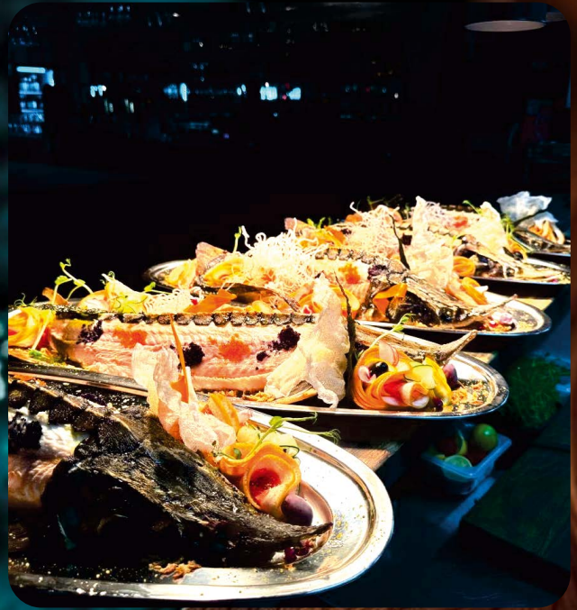
СТЕРЛЯДЬ ФАРШИРОВАННАЯ С ГРЕЦКИМ ОРЕХОМ И КИЗИЛОВЫМ СОУСОМ