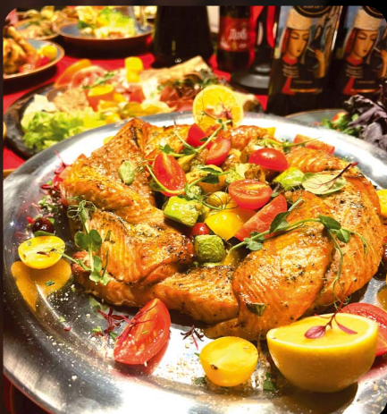
КОСИЧКА ИЗ СЕМГИ ЗАПЕЧЕННАЯ С ОВОЩАМИ