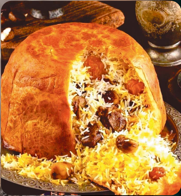
ШАХ ПЛОВ ИЗ БАРАНИНЫ