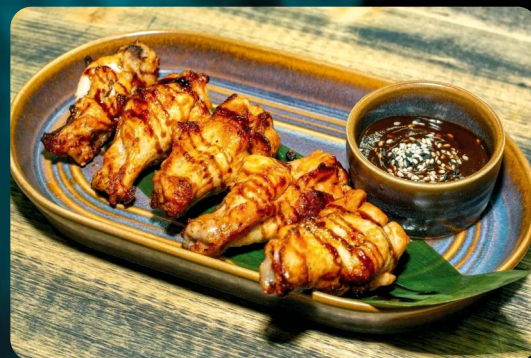
КУРИНЫЕ КРЫЛЬЯ ВВQ