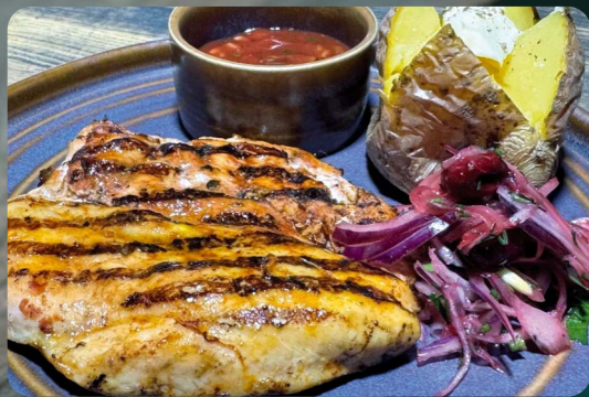
СТЕЙК ИЗ ФИЛЕ ИНДЕЙКИ

Шашлыки подаются с аджикой, зачечным картофелем, маринованным луком с вишней и зелень