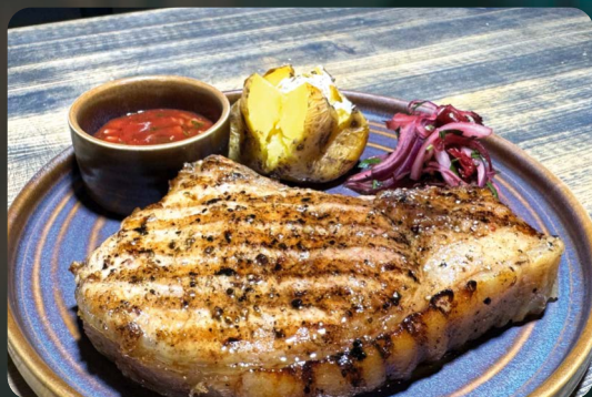
СВИНИНА НА КОСТИ