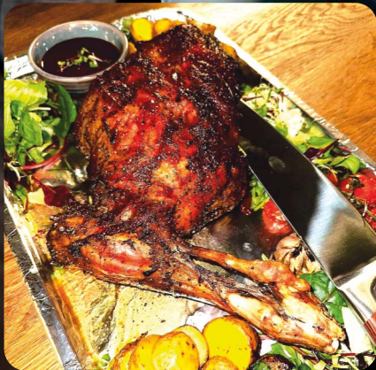
ЖИГО ИЗ БАРАНИНЫ