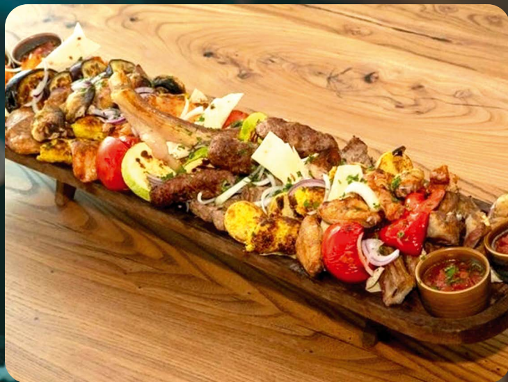
МЯСНОЕ АССОРТИ ШАХ-МАНГАЛ

Люля баранина, мякоть свинины, свиноговяжий люля, баранина ребра, куриный люля кебаб, индейка люля, куриные крылья, каре ягненка, мякоть баранины, бедро куриное, овощи гриль, бейби картофель